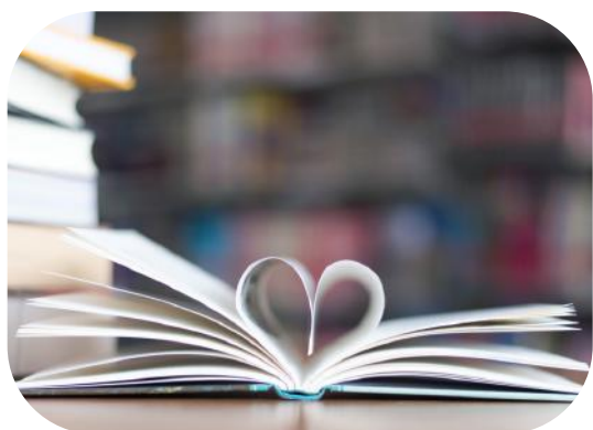
Co na półce